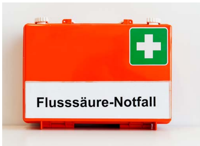
Abbildung 5: Flusssäurenotfallkoffer

Bei Unfällen mit Flusssäure sind Erste-Hilfe-Maßnahmen umgehend durchzuführen. Die mit Fluorwasserstoff, Flusssäure und anorganischen Fluoriden tätigen Personen müssen dazu über spezielle Erste-Hilfe-Maßnahmen und das Verhalten in Notfällen unterwiesen sein. Bei der Unterweisung ist vor allem auf die Notwendigkeit schnellen Handelns hinzuweisen.