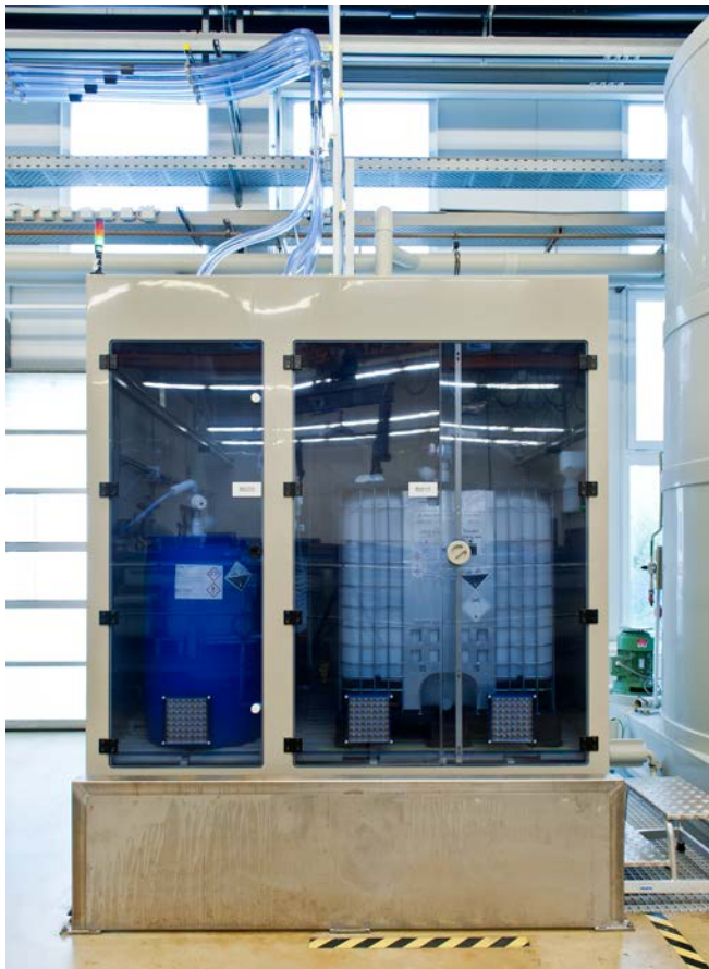
Abbildung 3: Geschlossene Anlage

Fußböden müssen gegen Flusssäure beständig, dicht und fugenlos sein. Sie dürfen nicht saugfähig sein.