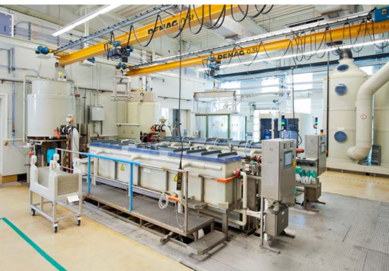
Abbildung 1: Anlage zum Ätzen/Polieren von Glasoberflächen

Flusssäure wird in vielen industriellen Prozessen eingesetzt. In der Glasindustrie ist dies zum Beispiel die Oberflächenbehandlung, wie das Ätzen und Polieren von Glas oder das Mattieren von Glasflächen. In der Implantologie wird 5%ige Flusssäure zum Anätzen von Zahnkeramik verwendet. Außerdem kann mit flusssäurehaltigen Produkten eine rutschhemmende Oberfläche auf Fliesen erzeugt werden. Auch in der Halbleiterproduktion sowie bei der Oberflächenbehandlung von Metallen findet man Flusssäure in Herstellungsprozessen. Daneben ist sie auch in verschiedenen Reinigungsmitteln, zum Beispiel für Natursteine und Fassaden, oder in Rostentfernern für Textilien enthalten.