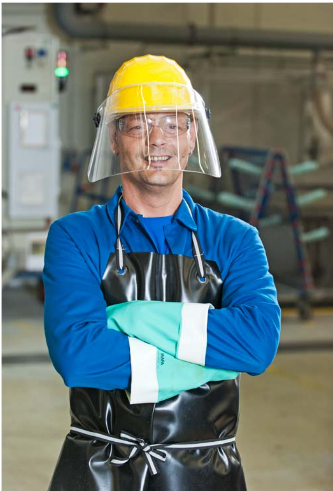
Abbildung 4: PSA bei Tätigkeiten mit Flusssäure