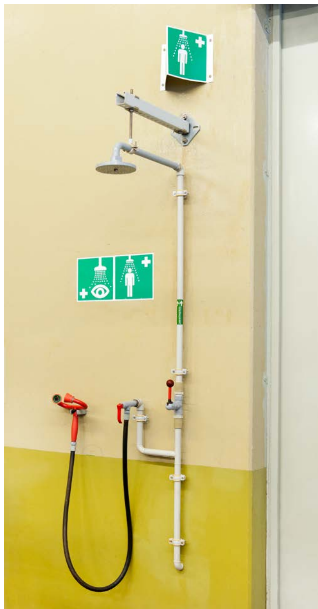
Abbildung 6: Augen-/Körperdusche

Sofort für Frischluft sorgen. Auch bei Beschwerdefreiheit mit erhöhtem Oberkörper lagern, ein Glucocorticoid-Dosieraerosol tief einatmen lassen und bei Atemnot Sauerstoff geben. Bei Atemstillstand künstliche Beatmung nur mit Beatmungsmaske und Beatmungsbeutel (Selbstschutz!).