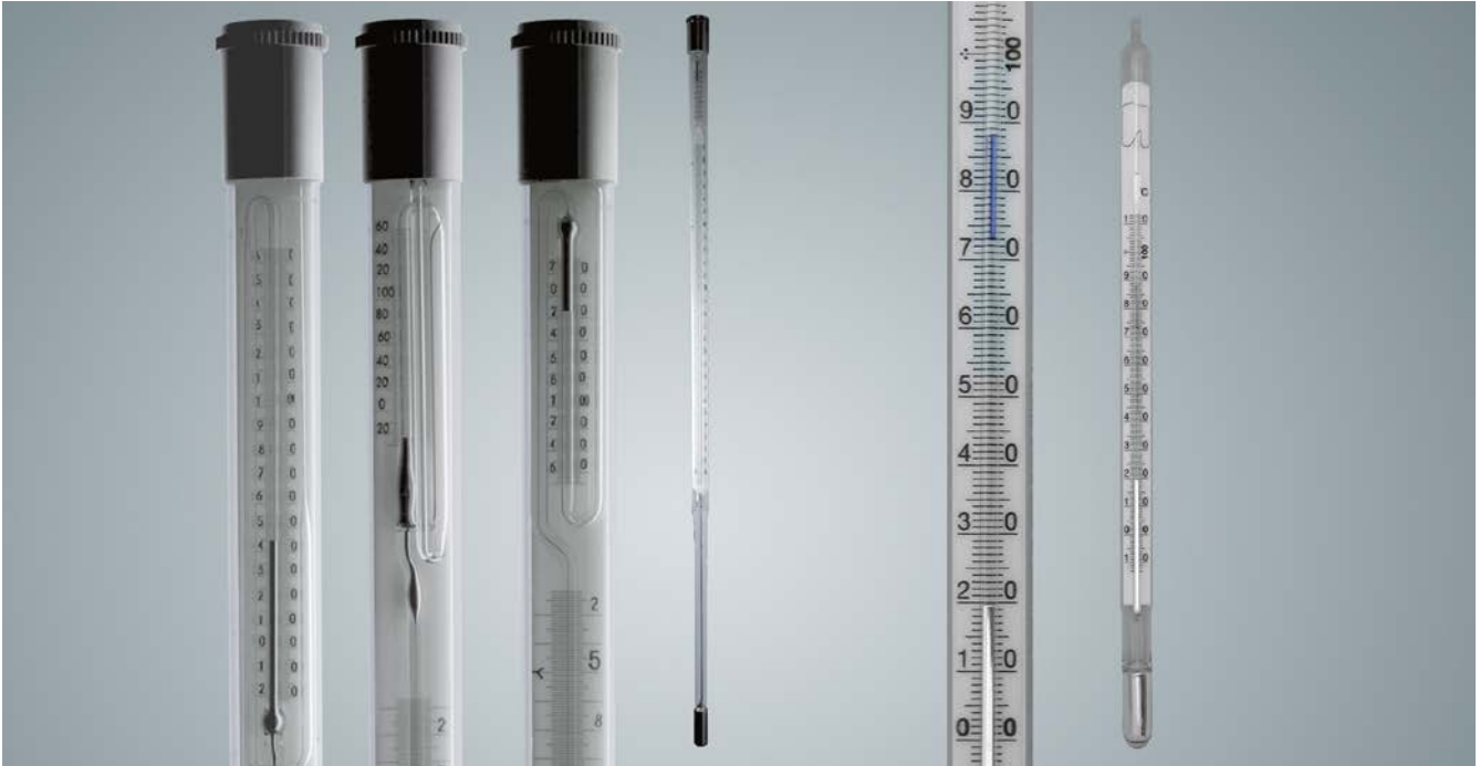
Abbildung 3: Quecksilberverwendung in Spezialthermometern (zum Beispiel Beckmann-Thermometer)

Das Muster ist mit Blick auf die spezifischen innerbetrieblichen Verhältnisse zu prüfen und zu überarbeiten. Die Angaben zu Fluchtweg, Unfalltelefon und Ersthelfer oder Ersthelferin sind zu ergänzen. Die Angaben zu Persönli-