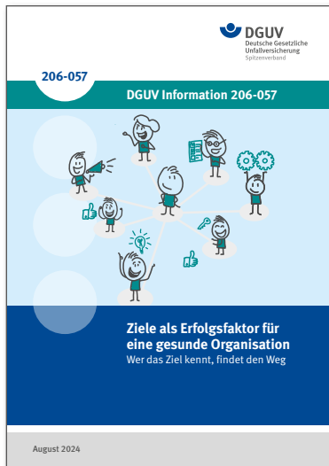
DGUV Information 206-057