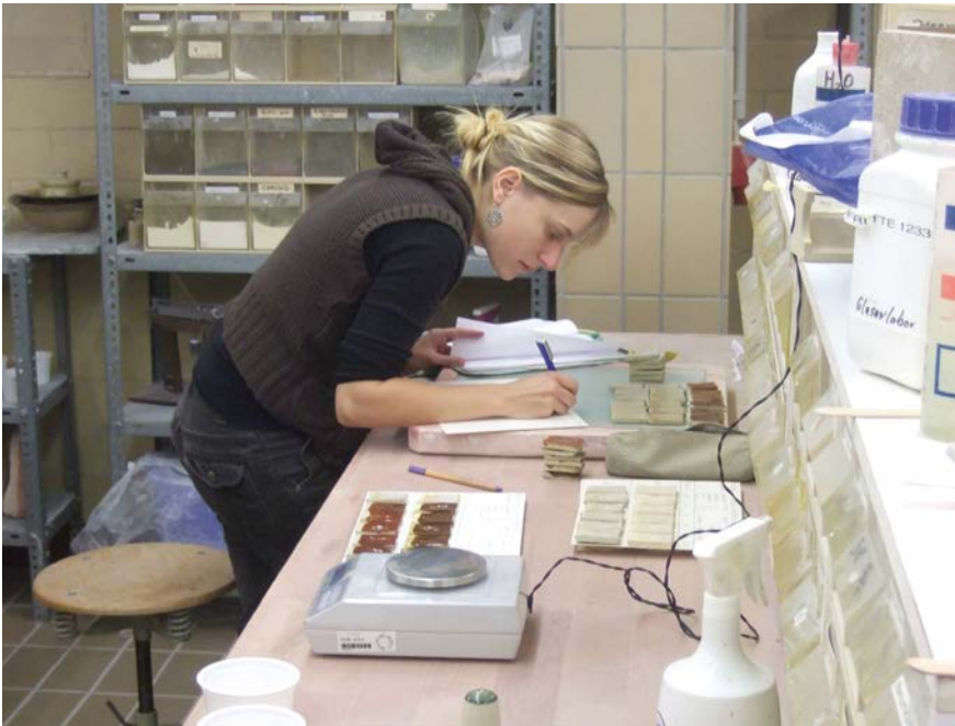
Abbildung 5: Arbeiten im Labor

einer Aufnahme in den menschlichen Körper besteht. Die Aufnahme kann oral oder durch Einatmen erfolgen.