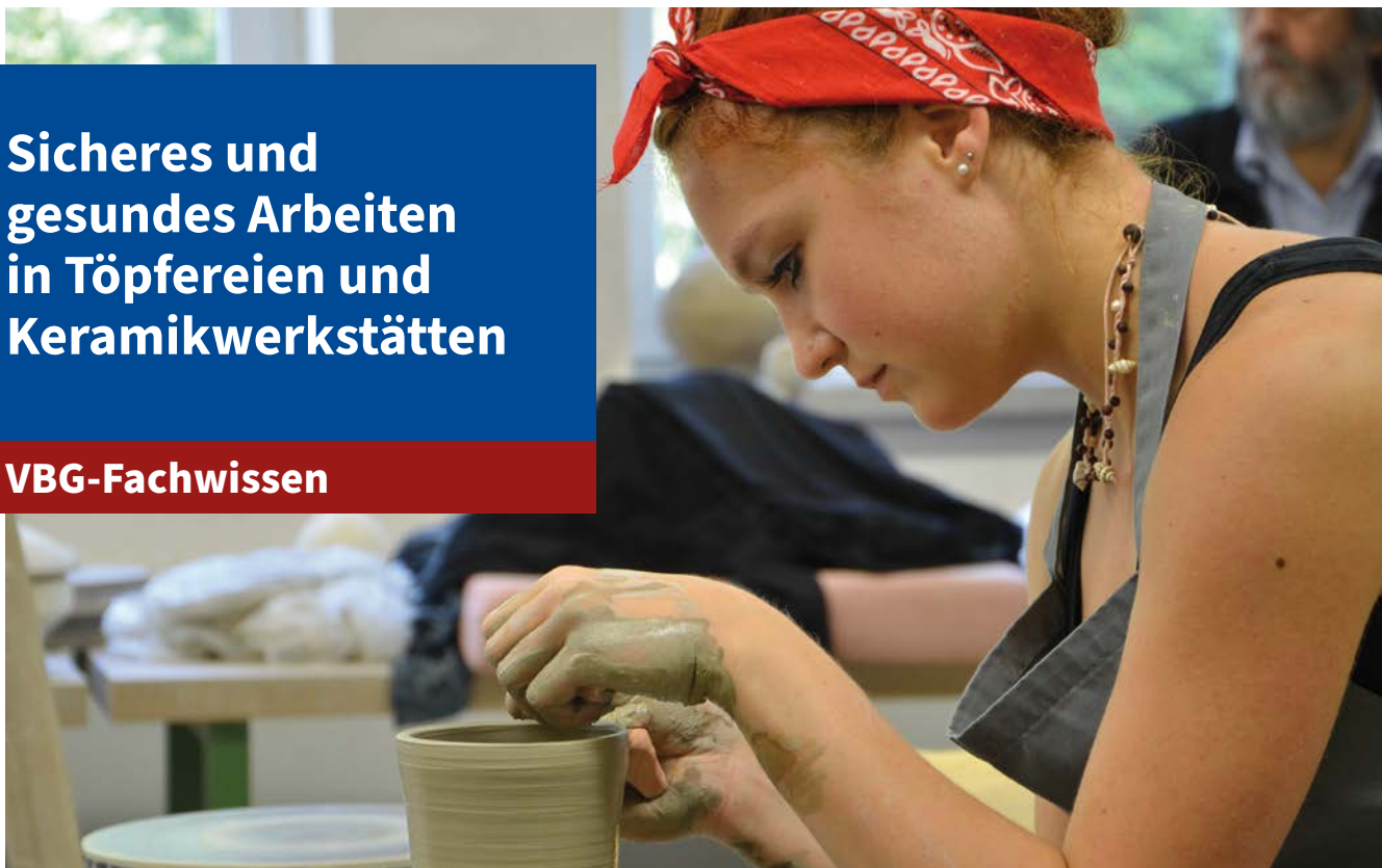
Abbildung 1: Drehen an der Töpferscheibe

Das VBG-Fachwissen zeigt die wichtigsten Gefährdungen bei der Herstellung von Gebrauchs- und Kunstkeramik auf und gibt sicherheitstechnische und arbeitsmedizinische Hinweise, insbesondere für Unternehmen mit bis zu 10 Beschäftigten. Die Schutzmaßnahmen haben das Ziel, die Gefährdung der Beschäftigten zu minimieren.