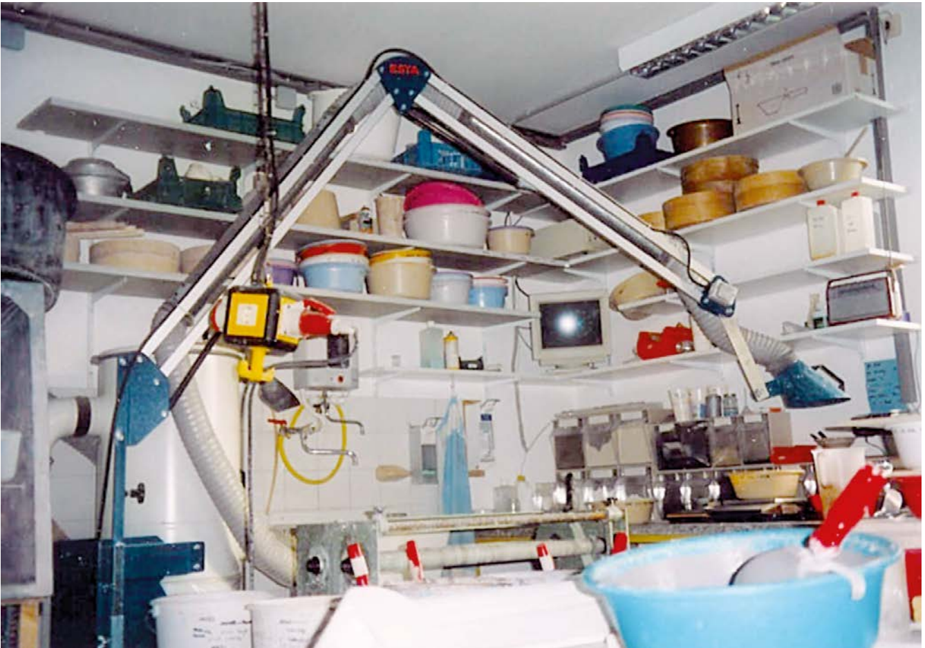
Abbildung 4: Glasuraufbereitung mit schwenkbarem Absaugarm