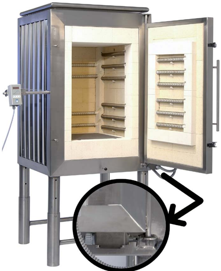
Abbildung 2: Elektrisch beheizter Brennofen mit Sicherheitsschalter